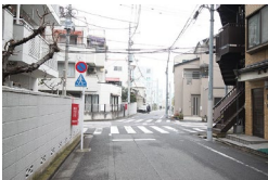
直進します。 Go straight for a while.