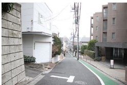
右手に大きなマンションが見える一つ目の角を左に曲がります。 Take the first left when you see big apartment on the right side.