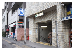
千石駅の 4A 番出口を出て左に進みます。 Go out from 4A Exit at Sengoku station and go to the left side.