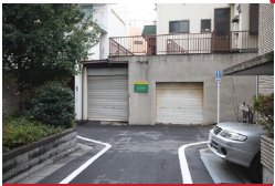
突き当たりを左に曲がります。 Turn left at the end of street.