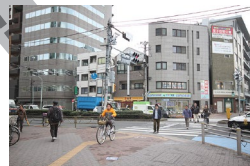
駅を出てすぐにある信号を渡り左に曲がります。 Cross the signal near station and turn left.