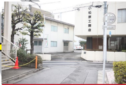
突き当たりを左に曲がります。 Turn left at the end of street.