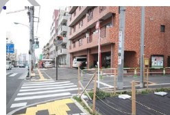
ガソリンスタンドが見えたらすぐにある赤いレンガマンションの角を右に曲がります。 When you see the gas station, turn right the corner there is apartment with red wall