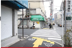
一つ目の角を左に曲がります。 Take the first left.