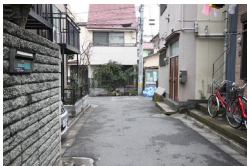
突き当たりを右に曲がります。 Turn right at the end of street.