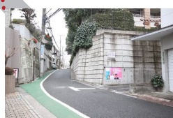
左手に大きなマンションのある小道を右に曲がります。 Turn left to the narrow road when you see the big apartment on the left side.