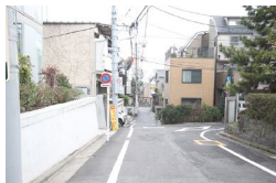
直進の細い道に入っていきます。 Go through the narrow road.