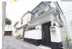
左手に大きなマンションのある小道を右に曲がります。 Turn left to the narrow road when you see the big apartment on the left side.