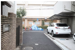
突き当たりを右に曲がります。 Turn right at the end of street.