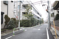
一つ目の角を左に曲がります。(手前にマンションの駐車場に入る角があるので注意) Take the first big corner left. (not take the first "small" corner left. It is private road.)