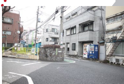
左手に大きなマンションのある小道を右に曲がります。 Turn left to the narrow road when you see the big apartment on the left side.