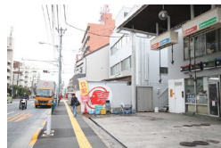
ガソリンスタンドが右手に見えるまで5分ほど直進します。 Go straight for about 5 min until you can see the gas station on the right side.