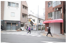
道路を挟んでマクドナルドの反対側にあるケーキ屋さん (patisserie Couleur) 脇の道に入ります。 Cross the road and go through the road beside the cake shop named "patisserie Couleur."