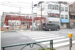
大きな道路に出たら信号を渡り右に曲がります。 Cross the road and turn right at the end of street.