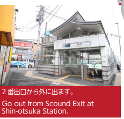
2 番出口から外に出ます。 Go out from Scound Exit at Shin-otsuka Station.