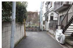
道なりに左に曲がります。 Turn left with follow the road.